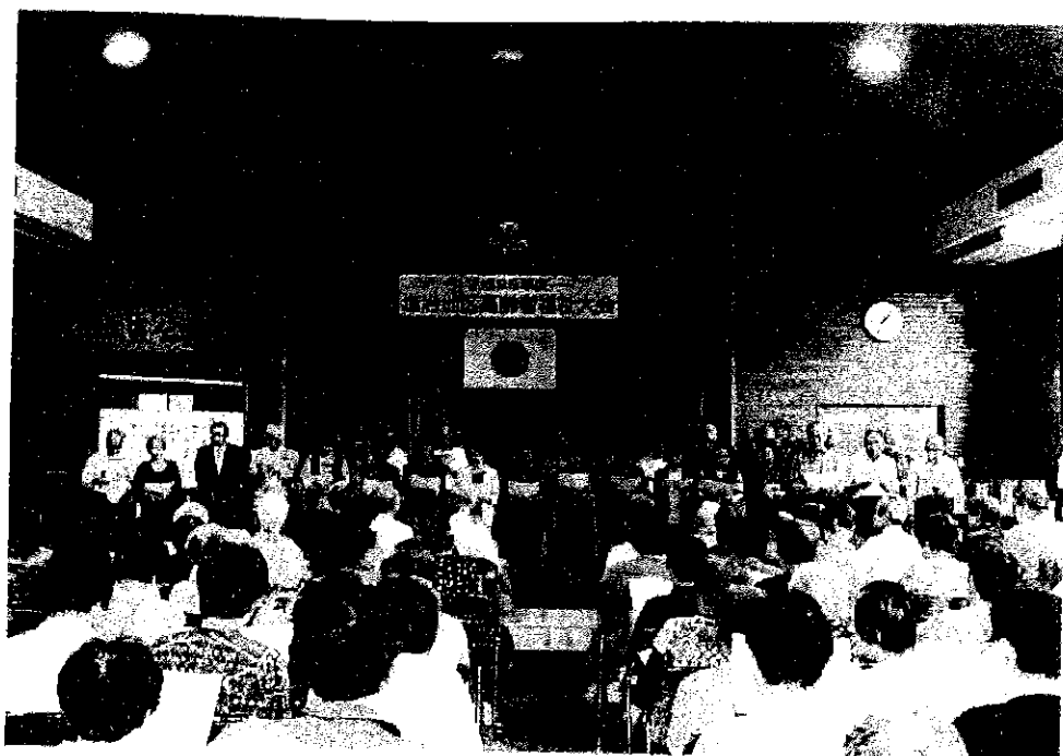
塩冶地区高齢者福祉大会 平成26年9月15日 塩冶コミュニティセンター