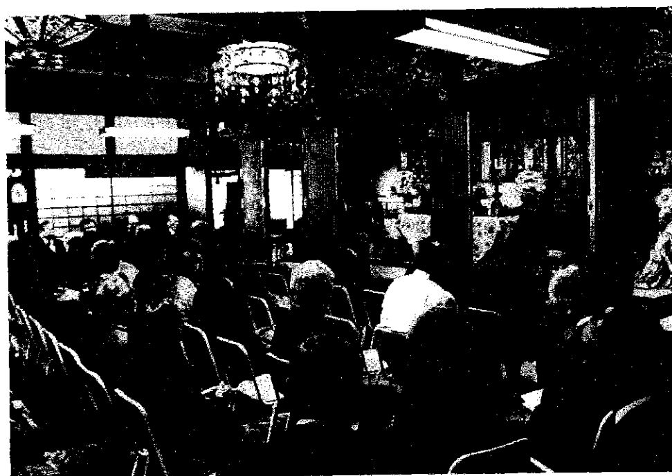
塩治地区戦没者追悼・平和祈念式 平成26年6月7日 長楽寺