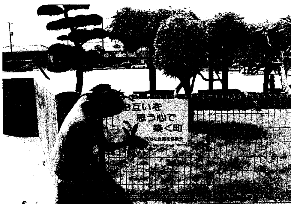
塩治地区内の公園の美化啓発看板の点検・清掃・補修活動 平成26年5月17日